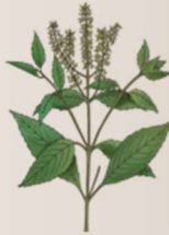
Ravin'ny rômba 20