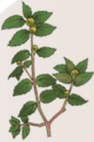
Raviny miaraka tahon'ny kinononono 12