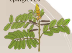
Ravin'ny quatre épingles 20