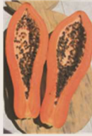
Vodiny sitronely araiky