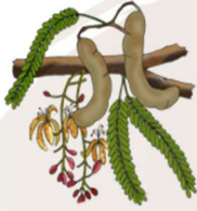
Raviny kininy 10

Madiro 04 mitovy amin'ny halavan'ny rantsan-tanana mapaza 20 disanina