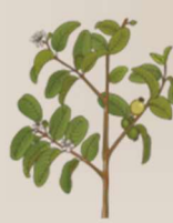
Ravin'ny gavo 20