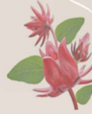
Raviny paka 10

Voany mena amin'ny duvin (madirom-bazaha)10